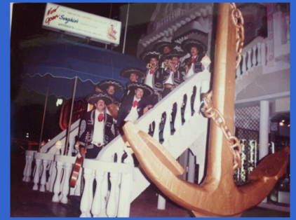
Mariachi Lirios del campo